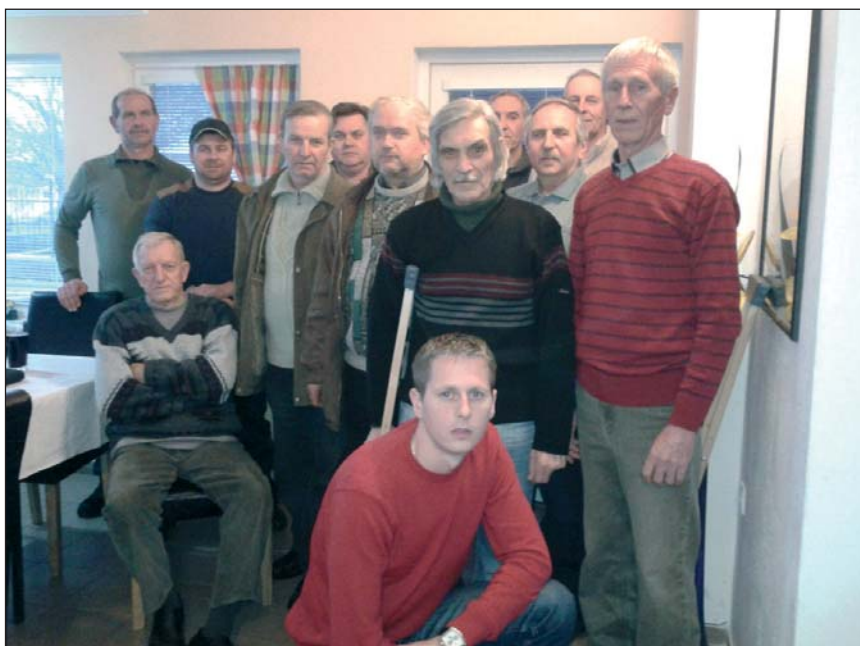
Výročná členská schôdza ZO CHPH Solčany ( december 2014 )