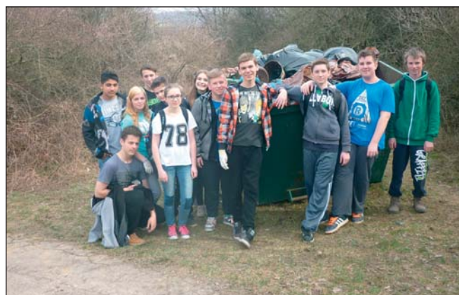
Deviatci odchádzali poslední

veľmi veľa ľudí. Toto ale neboli jediné šokujúce nálezy. Tí, ktorí chodia pravidelne do našich hôr mi iste potvrdia, že toľko neporiadku - hlavne plastových fľaš ešte v našej hore nebolo. Len pri ohnisku pri včeline sme ich nazbierali za 3 vrecia. A to sem chodia aj rodiny s malými deťmi. Aký príklad dávame deťom? Keby deti videli, že prázdne fľaše a ostatné odpadky vezmeme späť domov, vôbec im nemusíme hovoriť, že odpadky v lese neodhadzujeme, my by sme v škole nemuseli organizovať prednášky o nebezpečnosti divokých skládok a pekný jarný deň, ako bol 25. marec 2015 by sme nemuseli s deťmi zbierať odpadky po nás dospelých, ale by sme ho strávili príjemnou vychádzkou a spoznávaním nášho okolia. Na záver by som chcela poďakovať všetkým žiakom a učiteľom, ktorí sa Dňa Zeme zúčastnili, že odvedli kus poctivej práce. Aj keď sa nám nepodarilo vyčistiť Hôrku úplne, výsledok je viditeľný a len od nás všetkých závisí, či aj trvalý.