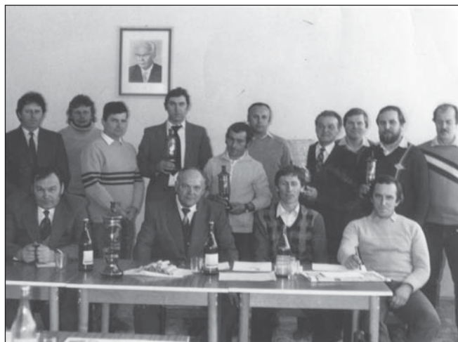
Výročná členská schôdza ZO CHPH Solčany v roku 1988