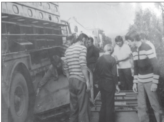
Nasádzanie holubov na pretek v Solčanoch ( okolo roku 1974 )